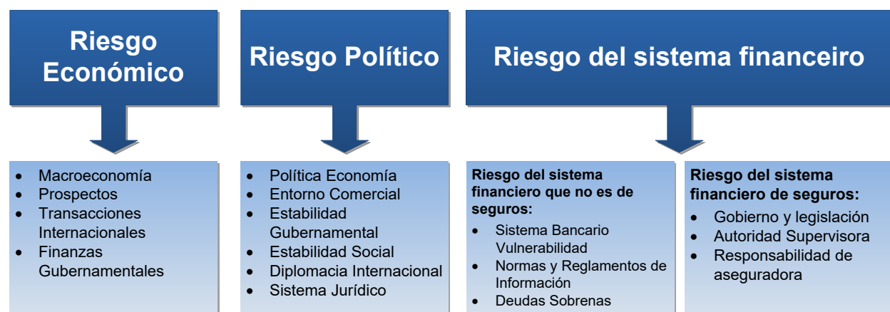
Tabla D.1: Componentes del Análisis de Riesgo País